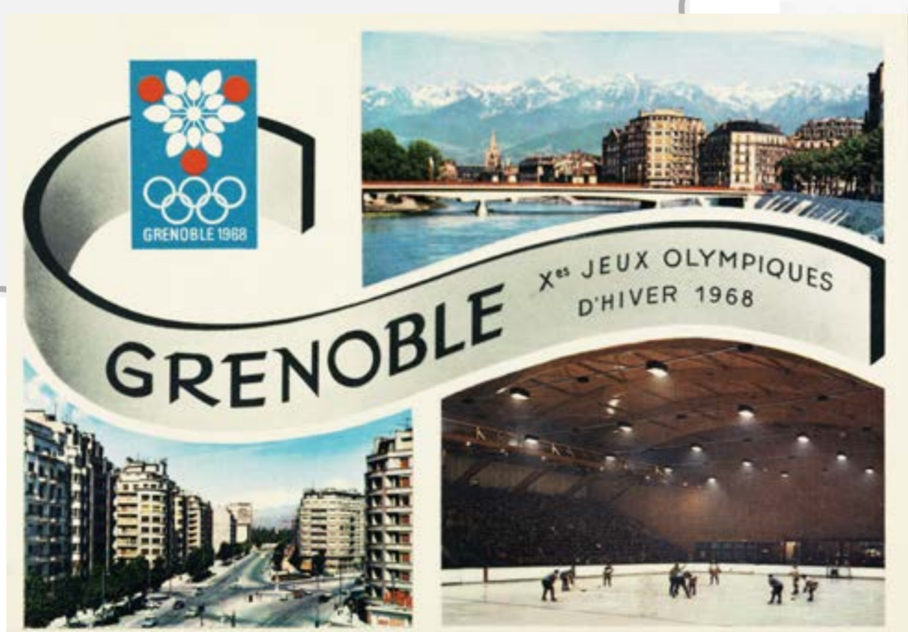
Carte postale des X e JO d'hiver, Grenoble 1968 Vue générale et chaîne Belledonne

Nombre de villes hôtes des Jeux Olympiques d'hiver depuis 1924, dont Grenoble, ne seraient plus en capacité de le faire d'ici 2050 à cause du réchauffement climatique.