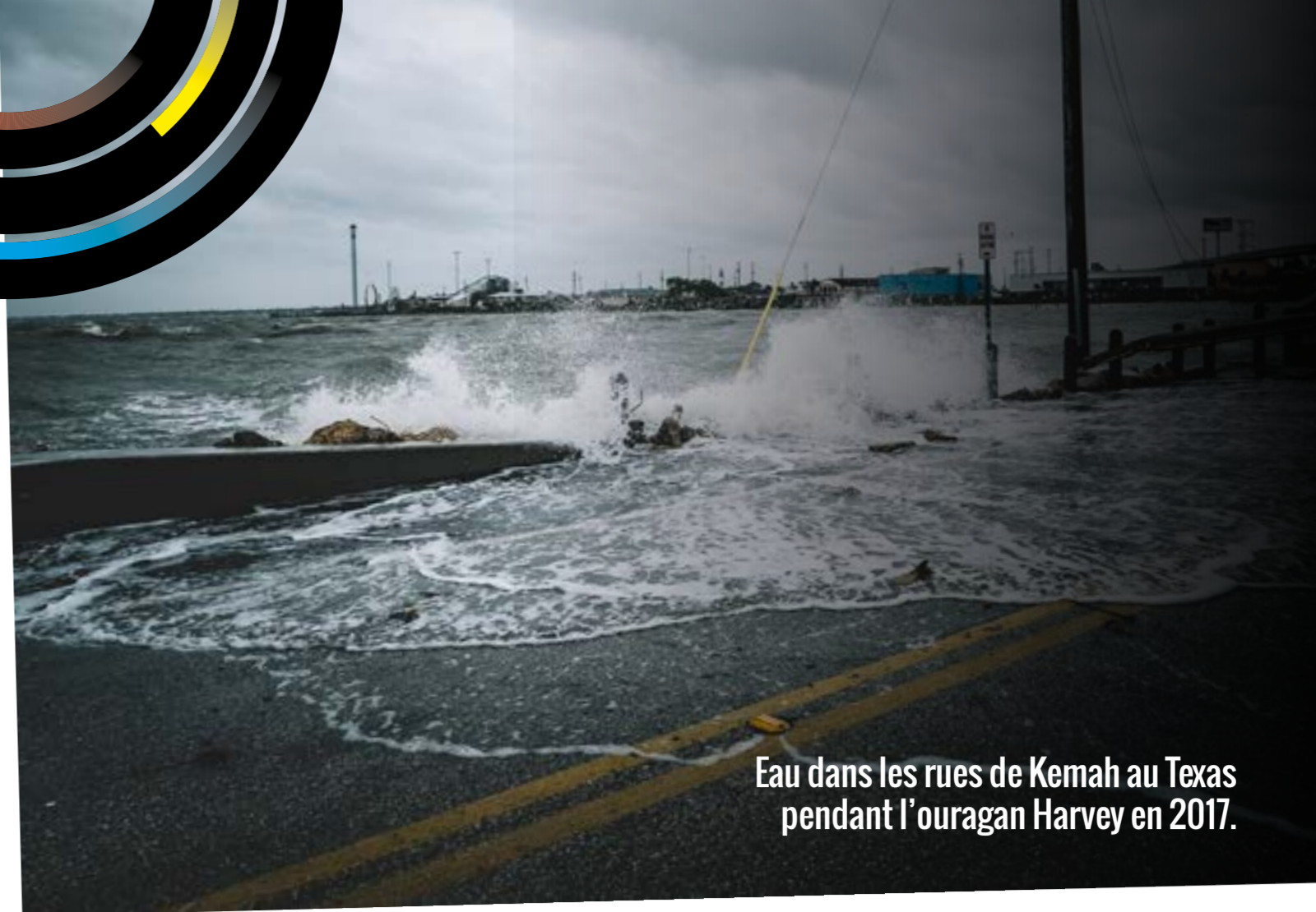
Eau dans les rues de Kemah au Texas pendant l'ouragan Harvey en 2017.