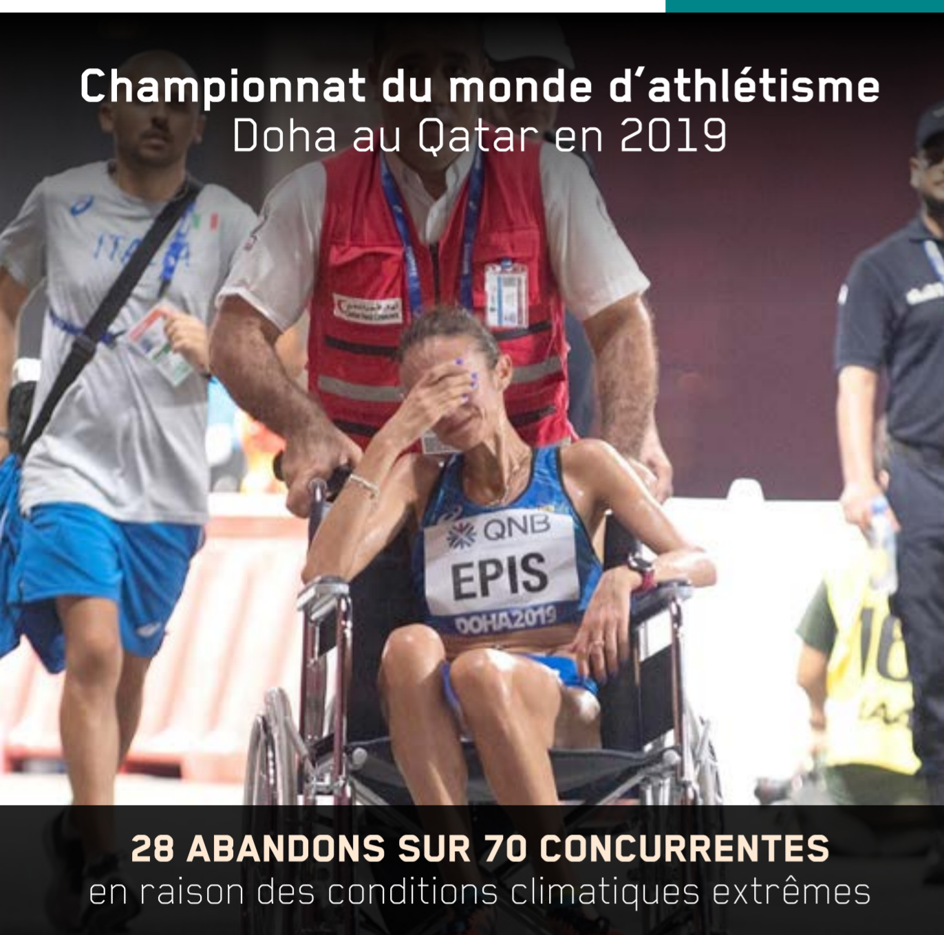
Championnat du monde d'athlétisme Doha au Qatar en 2019